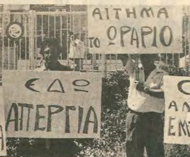
Από την απεργία που έγινε στο Διυλιστήριο τον Σεπτέμβριο του '76 όπου με τους αγώνες τους οι εργαζόμενοι κέρδισαν τότε αιτήματά τους.

σοβαρή από μέρος τους). Ηδη πληροφορηθήκαμε από επαφές μας με εργαζόμενους των Διυλιστηριών ότι κλήθηκαν για τους χειριστές θάρδιας (15.6.78) γενική συνέλευση για να μελετήσουν την κατάσταση όπως διαμερρώθη-